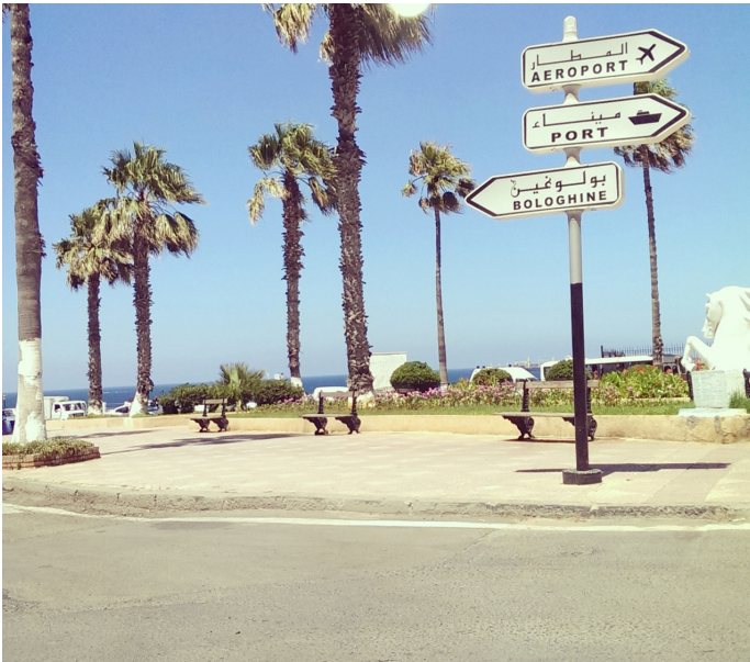
Sur la corniche, Alger

MEMBRE DE L'ICEB, INSTITUT POUR LA CONCEPTION ENVIRONNEMENTALE DU BÂTI